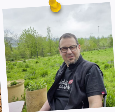
Noch unvertraut, aber der WBZ-Garten wird bald einmal erkundet.