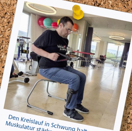
Den Kreislauf in Schwung halten, die Muskulatur stärken – eine Wohltat für Körper und Geist.