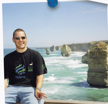
Sprachaufenthalt in Australien von 2003.