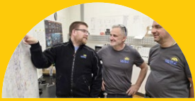
DAMIT STROM UND WASSER FLIEßEN

DAS MAGAZIN FÜR KUNDEN, SPENDENDE UND PARTNER DES WBZ