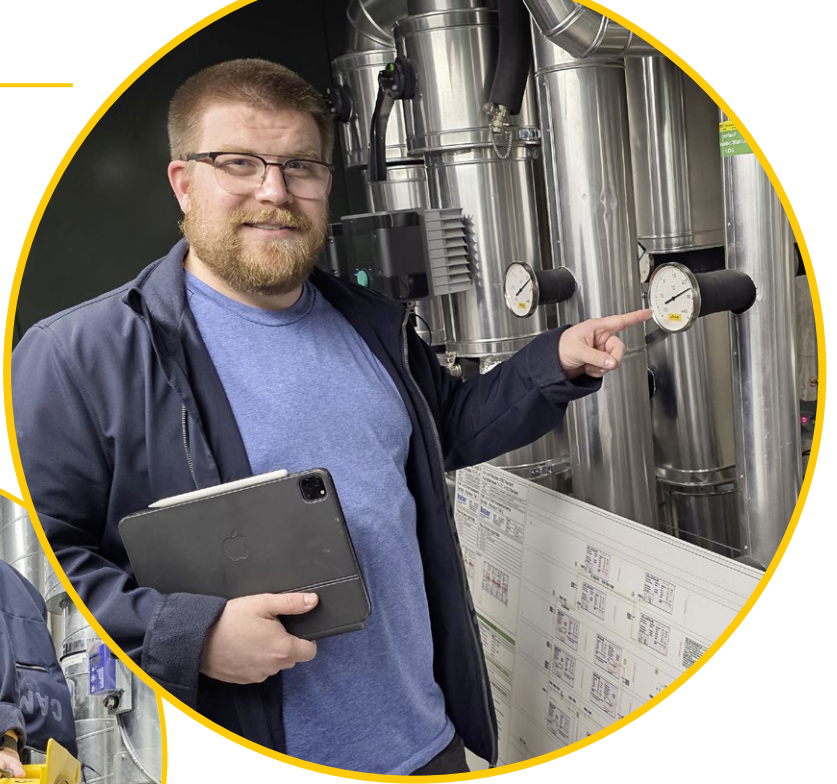
Nach einem Wasserschaden auf Kontrollgang im Technikraum.