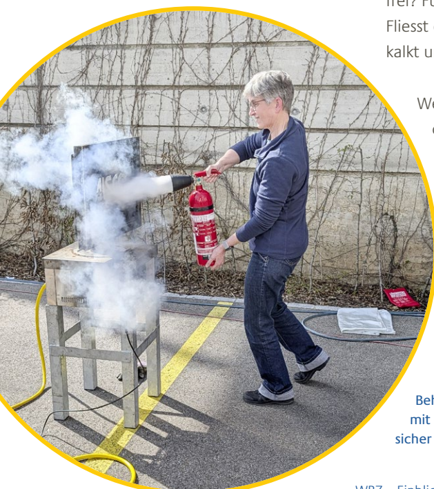
Beherrzt Hand anlegen: Wer in einer Übung mit einem Feuerlöscher hantiert hat, greift sicher auch im Brandfall unerschrocken zu.

Die Gebäudetechnik als einer von drei Bereichen der Infrastruktur versorgt das WBZ mit allen Formen von Energie: Wärme, Licht, Strom, Wasser, frische Luft. Fällt zum Beispiel irgendwo die Beleuchtung aus, wird das Elektrische überprüft, werden Einstellungen angepasst, Leuchtmittel oder Sicherungen auswechselt. Sobald es ein Spezialwissen braucht, stehen Externe als