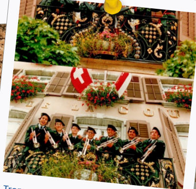
Trompetenregister in der Rekrutenschule von 1993.