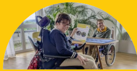
EIN GESPRÄCH AUF AUGENHÖHE