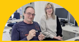
WIR DIGITALISIEREN DIAS