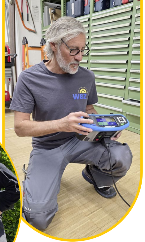
Die Mitarbeitenden haben für fast alles ein Gerät oder Werkzeug in petto.

Partner bereit. Sie kennen das WBZ in der Regel seit längerem und stimmen ihre Lösungen deshalb genau auf die Anforderungen des Betriebs und die Bedürfnisse der Menschen ab.