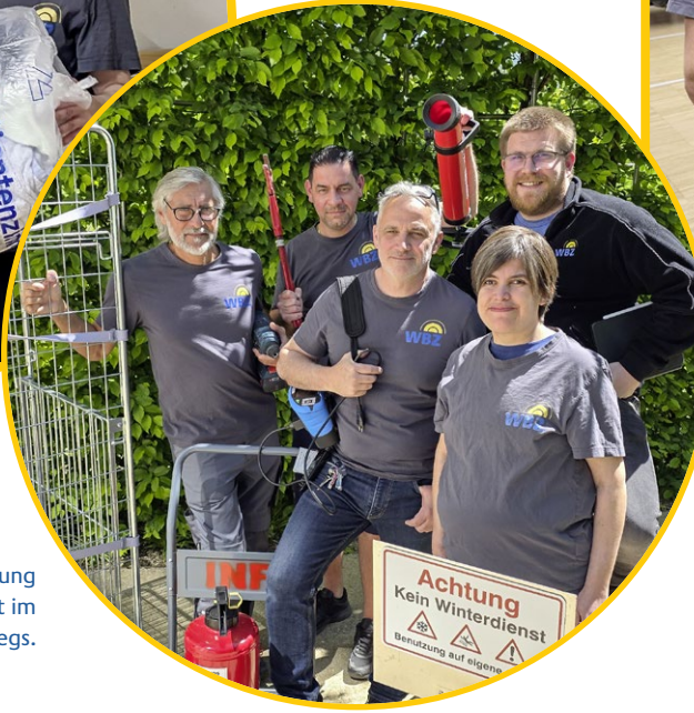
Gemeinsam als Abteilung Infrastruktur/Sicherheit im WBZ unterwegs.