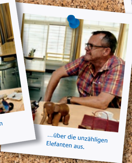
...über die unzähligen Elefanten aus.