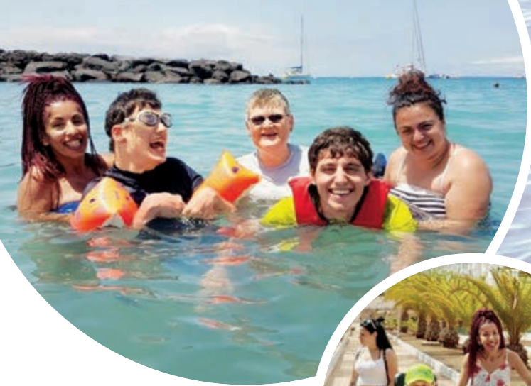
...auch im Meer ist es spannend.