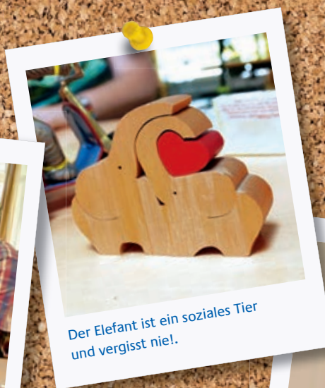
Der Elefant ist ein soziales Tier und vergisst nie!