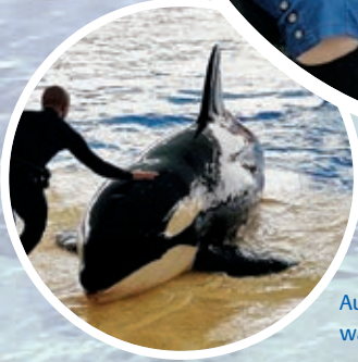
Auch der Loro Parque war ein Highlight.