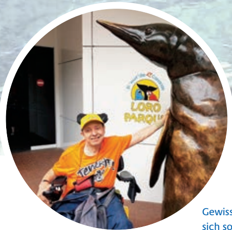
Gewisse Tiere liessen sich sogar streicheln.

«Das Abendbuffet ist riesig, ich bräuchte sicher einen Monat, um alles zu probieren. Für jeden Geschmack ist etwas dabei. Die Ästhetik des Hotels ist wunderschön, die Hotelatmosphäre gefällt mir sehr.»