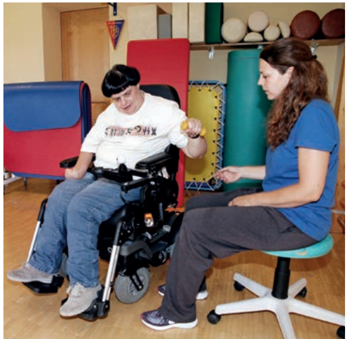
Mit gezielten Übungen geht es Schritt für Schritt voran.