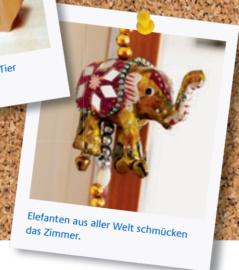
Elefanten aus aller Welt schmücken das Zimmer.