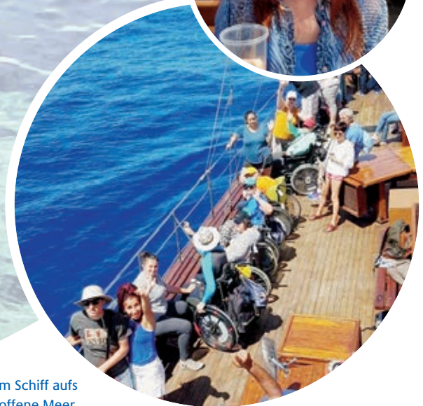
Mit dem Schiff aufs offene Meer.