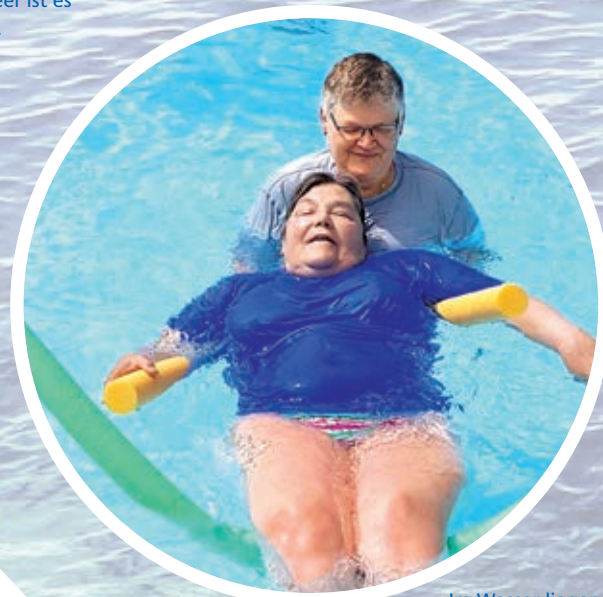
Im Wasser liegen ist entspannend und tut dem ganzen Körper gut.